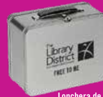
Lonchera de metal retro

Un registro por persona, premios disponibles hasta agotar existencias. Los empleados del Distrito Bibliotecario no califican para recibir premios.